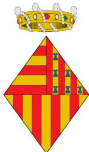
Ajuntament de Verges