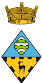
Ajuntament de Sils