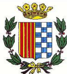
Ajuntament de Ribes de Freser