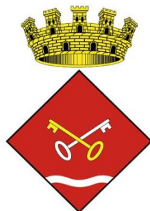
Ajuntament de Sant Pere Pescador