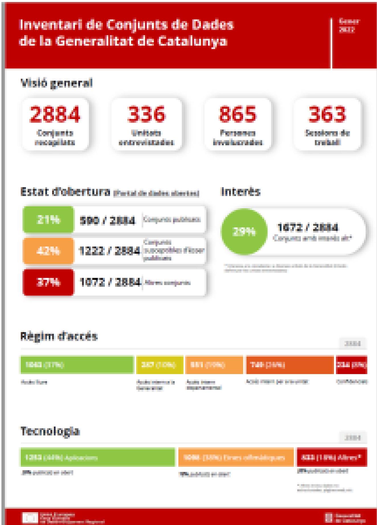
Indicadors de resultat de l'inventari fase 1

Del total de conjunts de dades identificats, 590, un 21%, actualment ja es troben disponibles al portal de dades obertes . Alhora, hi ha 1.222 conjunts, que representen un 42% dels identificats ,