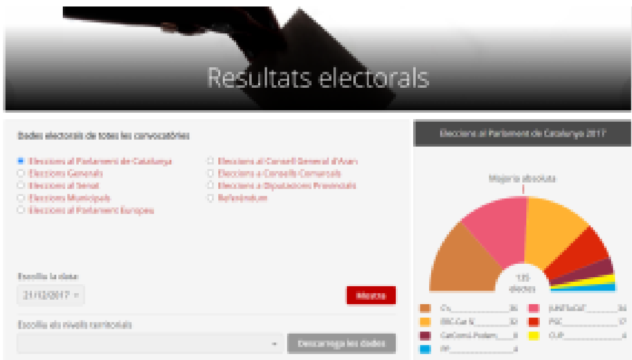
Foto: captura del visor de resultats electorals

La informació que conté el visor de resultats electorals es nodreix de la base dades electorals. La disposició de totes aquestes dades en forma de visor facilita la tasca a la ciutadania, que pot fer comparacions de resultats entre comicis o visualitzacions dels resultats en forma de mapa.